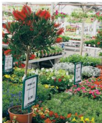
Nalod's regroupe 134 jardinerie indépendantes.